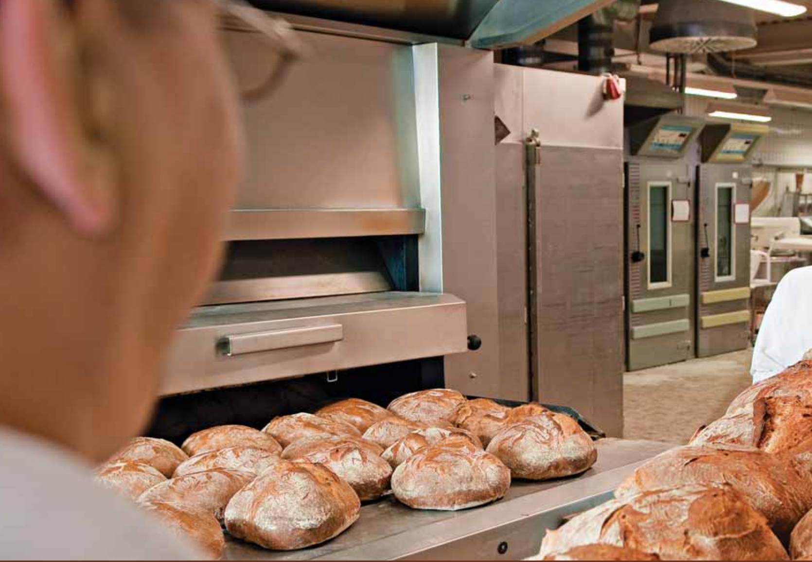
Frisches Ur-Brot kommt aus dem Ofen