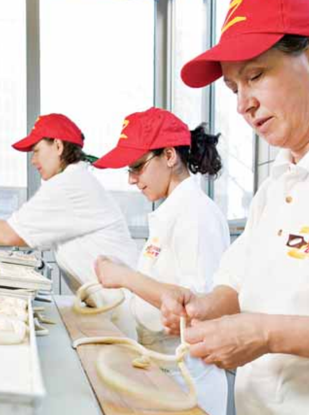
Auf den Dreh kommt es an