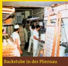
Backstube in der Pliensau