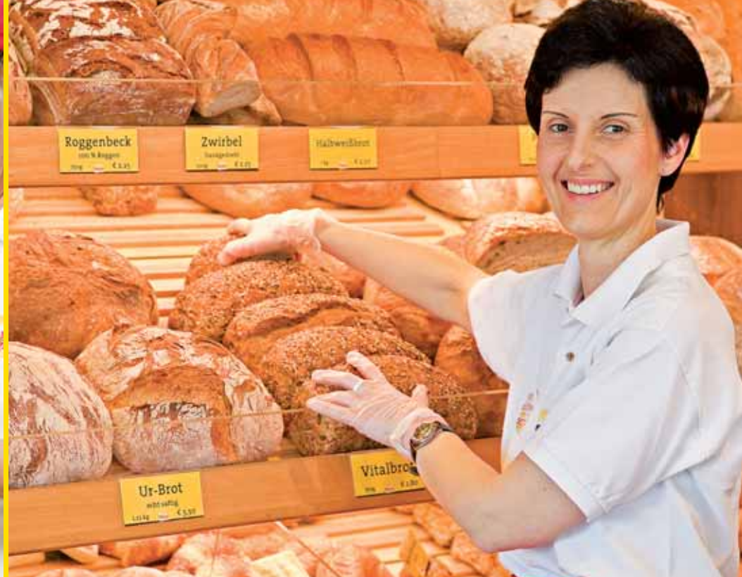
Über 20 Sorten Brot täglich frisch