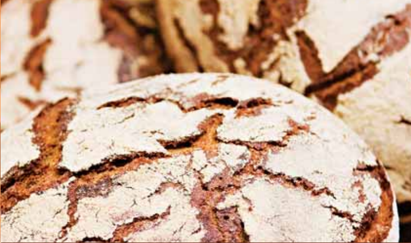
Roggen Nr. 1