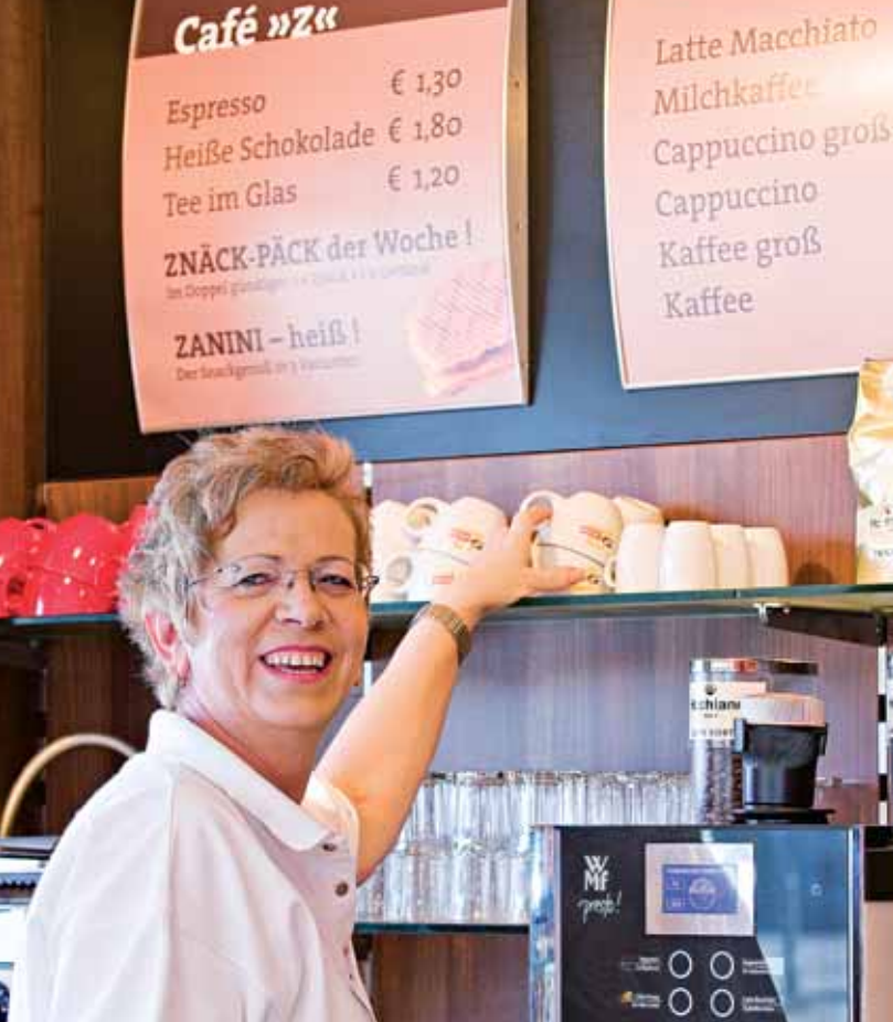
Genießen Sie unsere Kaffeespezialitäten