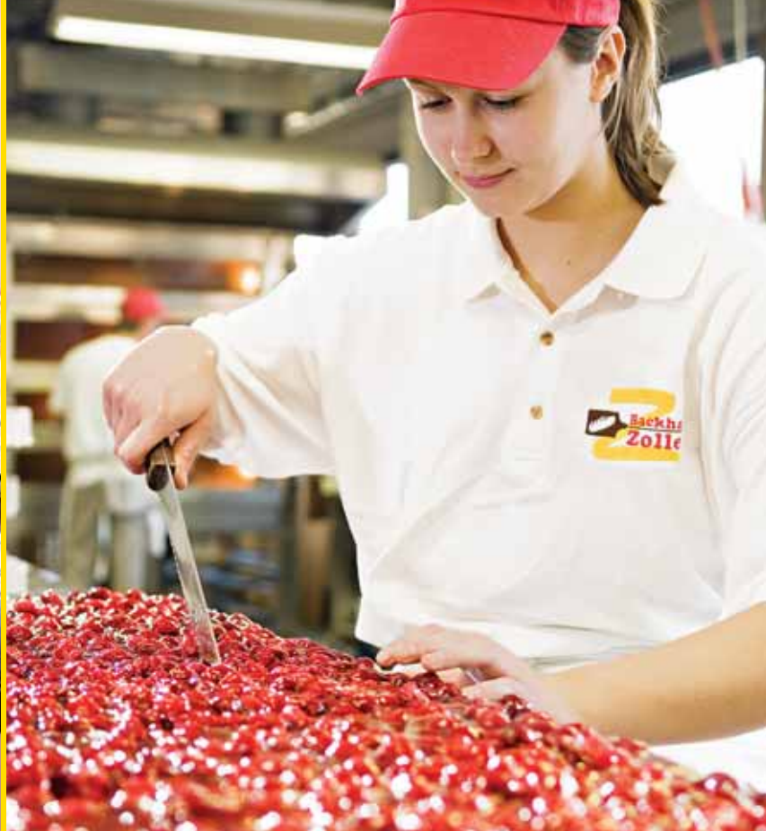
Täglich frisch, Obstschnitten aus unserer Konditorei