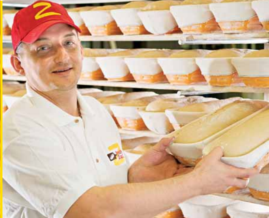
Die Erfahrung unserer Mitarbeiter ist die Qualitätsgrundlage