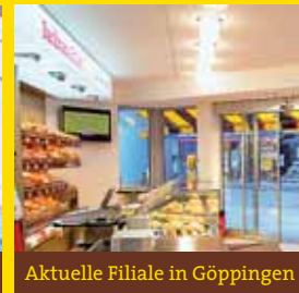
Aktuelle Filiale in Göppingen